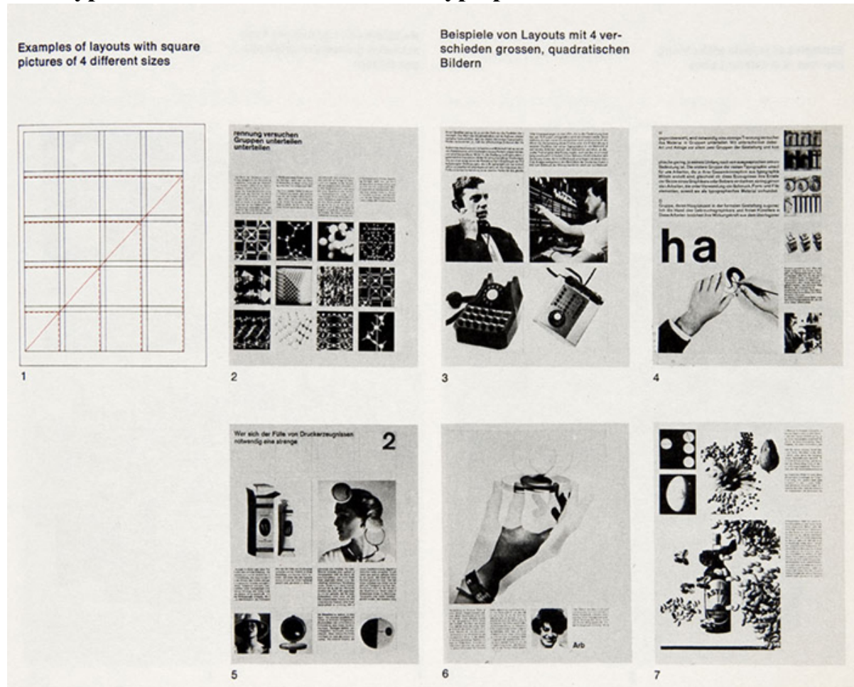
extrait de Grid systems, de Josef Müller Brockmann